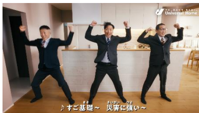
③ ♪すご基礎 災害に強い