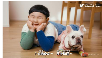
④ ♪心地ゆか 年中快適