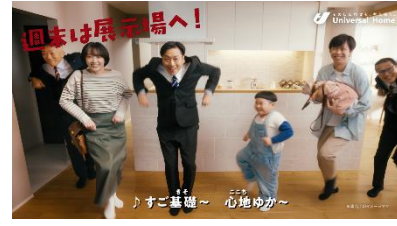
⑤ ♪すご基礎 心地ゆか