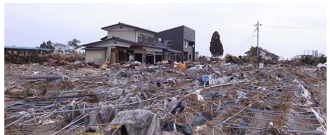
津波に耐えたユニバーサルホーム『地熱床システム』の家。床下がない為、流されずに済んだ。この家が防波堤となり、隣家も被害を免れた。

また、近年多発しているゲリラ豪雨や台風による甚大な被害にも、床下がない『地熱床システム』は効果を発揮します。豪雨によって家が床下・床上浸水してしまった場合、土砂の排出や床下の修繕等が必要になり、消毒等を行わなければその家に住み続けることはできません。ユニバーサルホームは、総合的にバランスのとれた災害対策が講じられた、“大切な子供たちの命をしっかりと守る住まい”のご提供をし続けていきたいと思ひます。