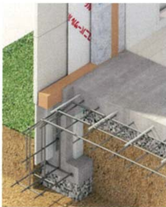
地熱床システム断面イメージ

砂利を地面から床下まで敷き詰め、密閉した地熱床システム。線路に敷き詰められた砂利と同じように、大型車両などによる外部からの振動を吸収・分散する特許工法の基礎です。その上、砂利は地面とほぼ一体化し、外部からの圧力も砂利間で吸収・分散するため、地盤にかかる負担を大幅に軽減し、地震振動の吸収、床下浸水の防止など、万が一の災害から暮らしを守ります。これが、ユニバーサルホームならではの家族の守り方なのです。