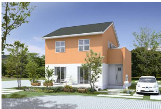
FOR KIDS スペシャルエディション タイプA

キッチンに立つママからリビングダイニングは、2階につながる階段まで見渡せていつでもお子さまを見守れます。効率的な収納スペースも多く設けているので、子供が大きくなるにつれて増える荷物もしっかりできます。また、サンルームも標準なので休日もゆったりくつろげ、家族みんなが大満足できる設計となっております。