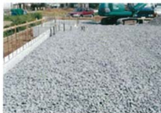
敷き詰められた砂利が振動を分散・吸収します。

砂利を地面から床下まで敷き詰め、密閉した地熱床システム。線路に敷き詰められた砂利と同じように、大型車両などによる外部からの振動を吸収・分散する特許工法の基礎です。その上、砂利は地面とほぼ一体化し、外部からの圧力も砂利間で吸収・分散するため、地盤にかかる負担を大幅に軽減し、地震振動の吸収、床下浸水の防止など、万が一の災害から暮らしを守ります。これが、ユニバーサルホームならではの家族の守り方なのです。