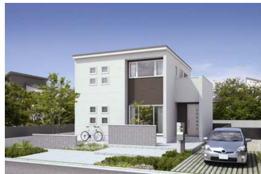
FOR KIDS スペシャルエディション タイプB